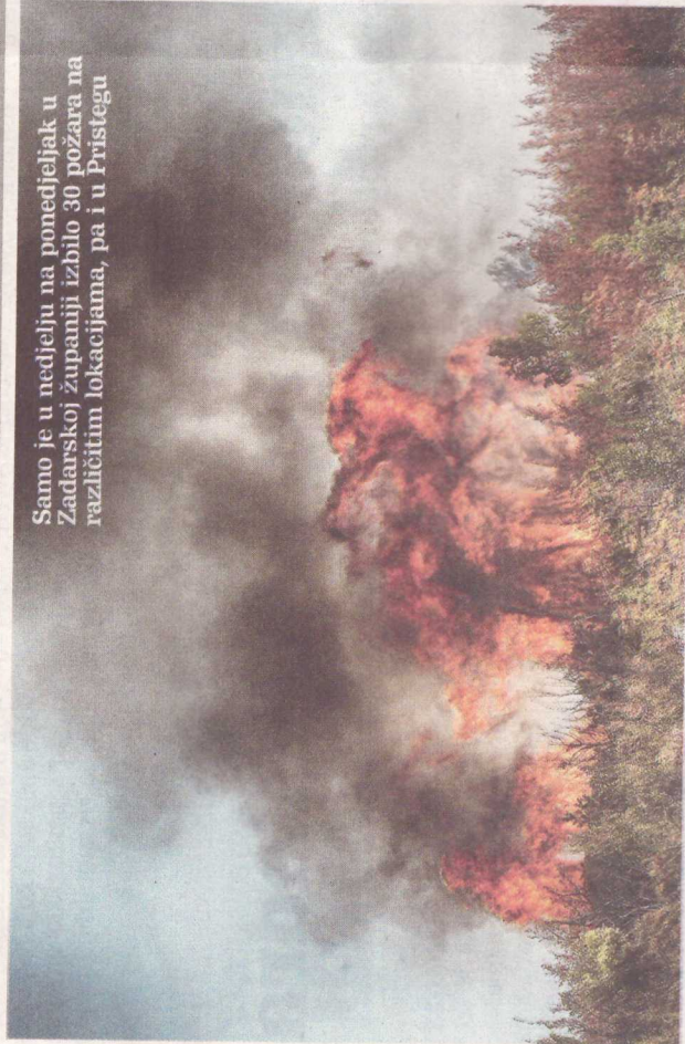
Samo je u nedjelju na ponedjeljak u Zadarskoj županiji izbio 30 požara na različitim lokacijama, pa i u Pristegu

cinacije, čuju glasove. - Kod ovih masovnih požara sigurno se može naći puno uzroka i motiva. Moćno je da se i u ovim požarima našao pravi piroman, osoba koja pati od poremećaja kontrole nagona, ne